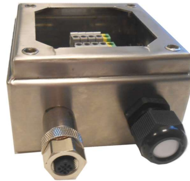
Connector gemonteerd op Ex e klemmenkast Connector mounted on Ex e junctionbox